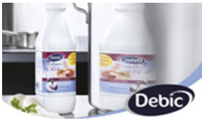
Panna da cucina Culinaire Debic. La panna più ricca e cremosa di sempre.